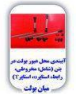
آیندی محال محور بولت در جن (شامل: میکروپی، رایج، استایرن، استایرن T) میان بولت