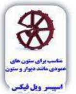
مناسب برای ستون های عمودی مانند دیوار و ستون اسپیسر ویل فیکس