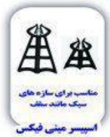
مناسب برای سازه های سنگ مانند سلف اسپیسر مینی فیکس