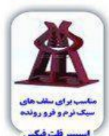
مناسب برای سلف های سنگ نرم و فرو رونده اسپیسر فلت فیکس