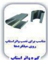
مناسب برای نصب واتر استاپ روی میگردد گیره واتر استاپ