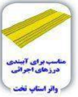
مناسب برای آییندی درزهای اجرایی واتر استاپ نخت