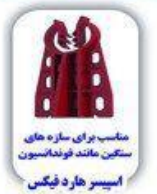
مناسب برای سازه های سنگ مانند فونداسیون اسپیسر هارد فیکس