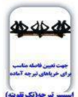
جهت تعیین فاصله مناسب برای خرماهای تیرچه آماده اسپیسر تیرچه (تک توتونه)