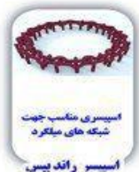
اسپیسر مناسب جهت شبکه های میگردد اسپیسر راندریس