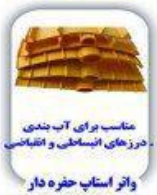
مناسب برای آب بندی درزهای انبساطی و انقباضی واتر استاپ حفره دار