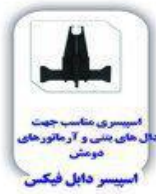
اسپیسر مناسب جهت دال های بتنی و آرماتورهای دوش اسپیسر دابل فیکس