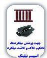
جهت پوشش میگردد لایه حکیم خاک و کانت میگردد اسپیسر فیلنگ