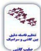
تنظیم فاصله دقیق بین کاشی و سرامیک صلیب کاشی