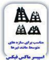
مناسب برای سازه های متوسط مانند لیرها اسپیسر ماکس فیکس