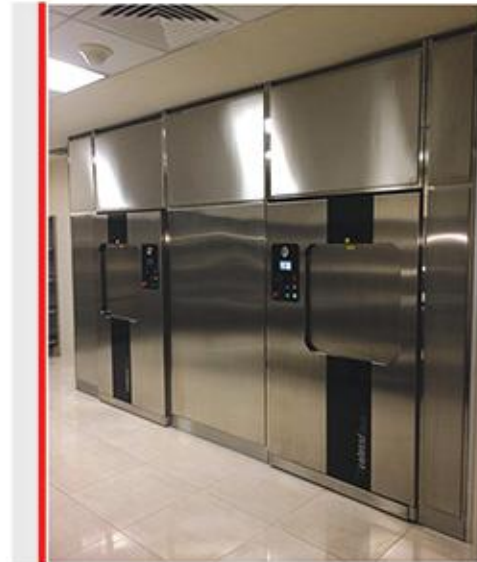
نمونه ای از دیوارکشی استیل بین دستگاه های اتوکلاو